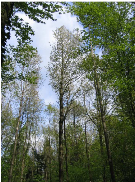
Vogel-Kirsche im Glottertäler Wald